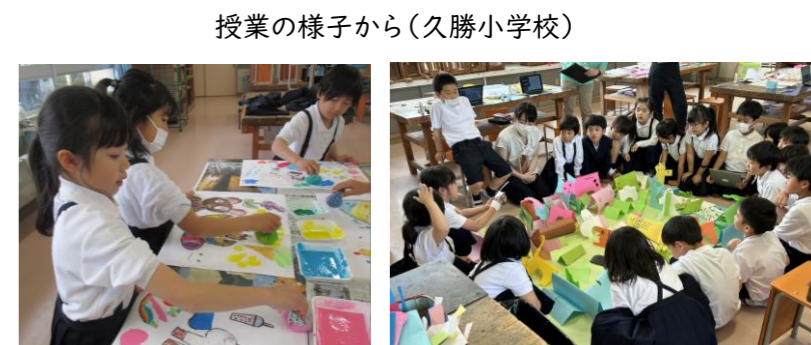
授業の様子から(久勝小学校)