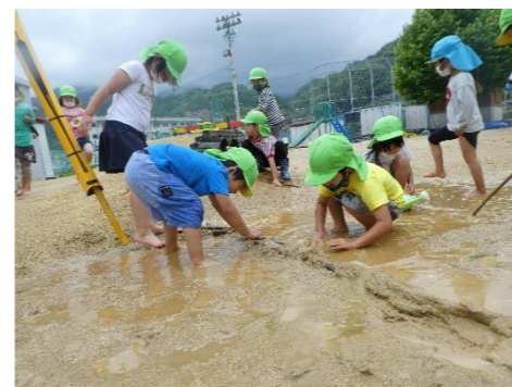
保育の様子から(半田幼稚園)

6 後 援 愛媛県教育委員会、香川県教育委員会、高知県教育委員会 徳島県国公立幼稚園・こども園長会、徳島県小学校長会、徳島県中学校長会 徳島県高等学校長協会、徳島県教育会、日本教育公務員弘済会徳島支部